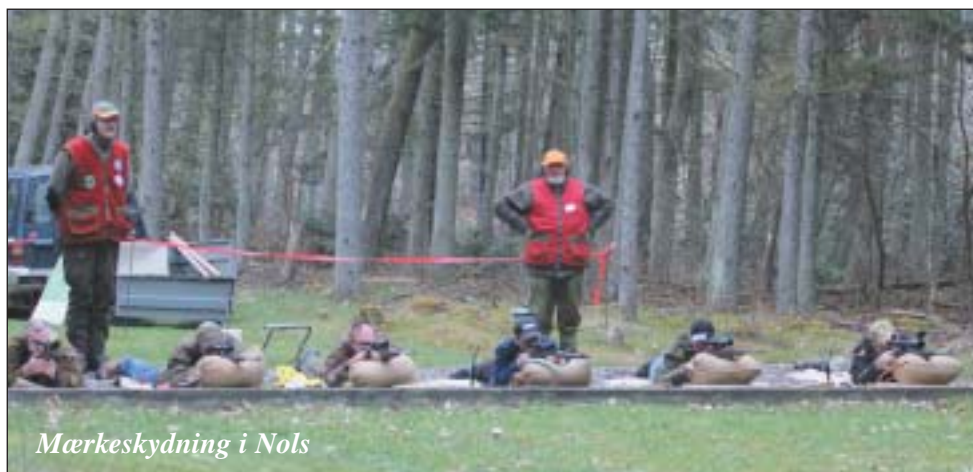
Mærkeskydning i Nols

Fra middagstid var der, som sædvanlig, mærkeskydning. Det samlede resultat, målt i ”blik” var: