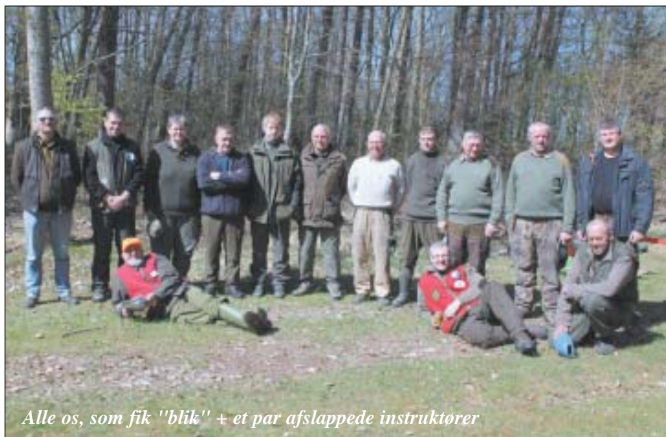
Alle os, som fik "blik" + et par afslappede instruktører

Se deres egen spaltepads :) Masser af god læsning.