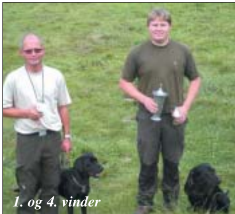
1. og 4. vinder